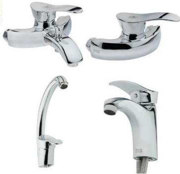
شیشه مدل جیحون