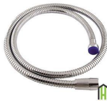
شودر لیا کروم