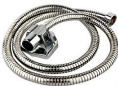
قهرمان کروم مشکی