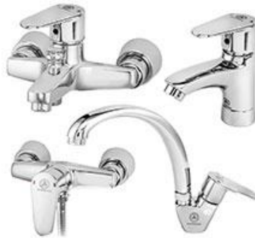
قهرمان مدل سهند