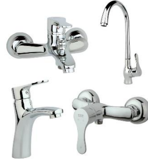
راسان مدل صدف